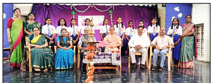
6-8-2024 - ಮೇರಿ ಇನ್ಯಾಕ್ವಿಲೇಟ್ ಗರ್ಲ್ಸ್ ಹೈಸ್ಕೂಲ್, ಶಿವಮೊಗ್ಗ