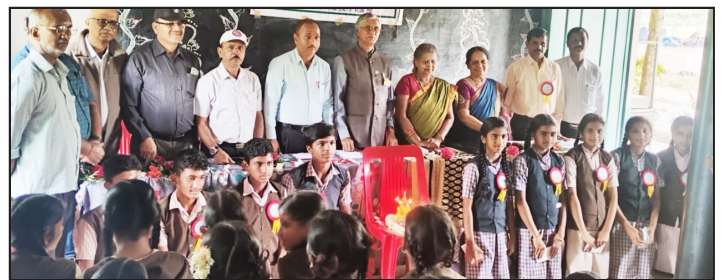
2-8-2024 - ಶ್ರೀ ಮಂಜುನಾಥೇಶ್ವರ ಹೈಸ್ಕೂಲ್, ಕುಂಪಿ