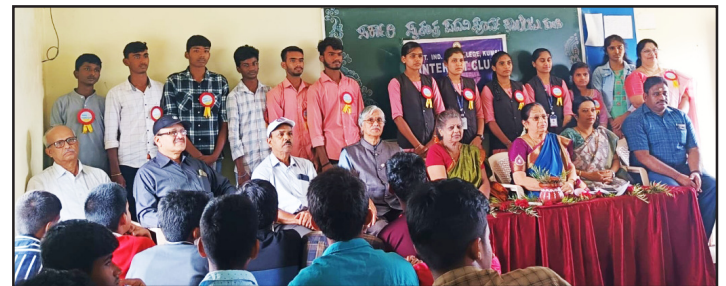
2-8-2024 - ಸರ್ಕಾರಿ ಪದವೀಪೂರ್ವ ಕಾಲೇಜ್, ಕುಂಪಿ