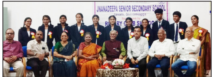
1-8-2024 - ಜ್ಞಾನದೀಪ ಪ್ರೌಢಶಾಲೆ, ಜಾವಳಿ